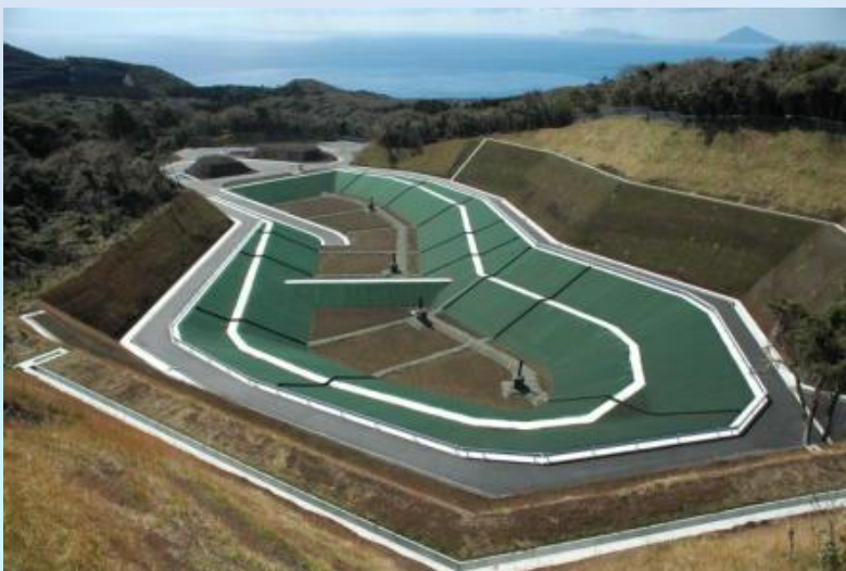
(写真左：大島処分場 下：八丈島処分場)