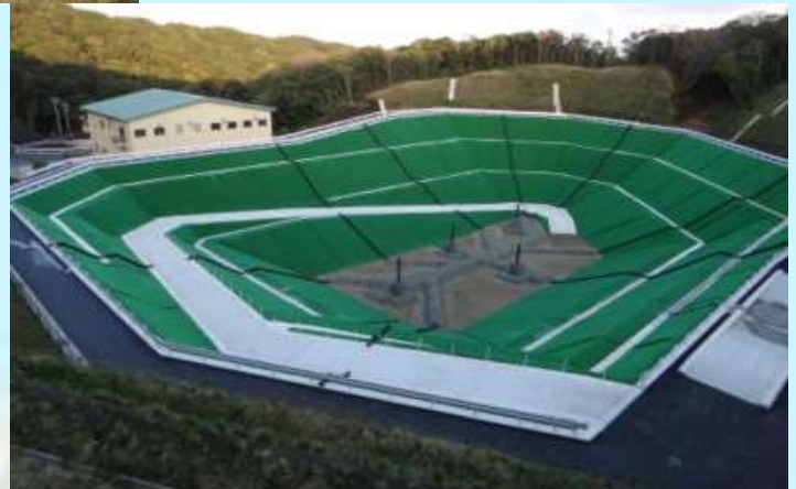
(写真左：大島処分場 下：八丈島処分場)