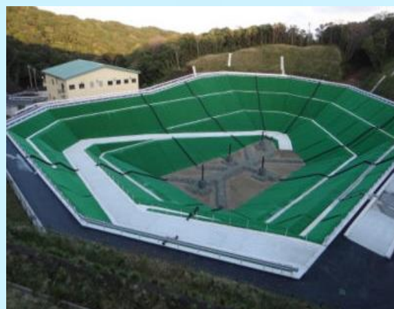
(左：大島処分場 右：八丈島処分場)